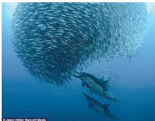
图1 摄影师在南极拍摄到企鹅捕猎前群集鱼类的图片

在落叶飘飞的秋天,人们经常看见大雁排着整齐的“人”字型队伍迁徙到南方;在阴暗潮湿的环境下,细菌部落聚集而生;夏天池塘的青蛙同时发出“哇哇”的叫声;夏日的一群萤火虫同时发出一道一闪一闪的光线;自然界中成群的蜜蜂,事先没有商量建筑蜂巢的蓝图,但是它们各自搬运泥土,筑成了坚固的蜂巢;在海洋中某些鱼类,具有规则队形聚集在一起运动,当发现新的食物来源或者受到外部攻击时,原来规则的队形被打乱了,但是在没有外界力量的介入下,一段时间之后,这群鱼类又建立了规则的队形聚集在一起运动,如图1是摄影师在南极拍摄到企鹅捕猎前群集鱼类的图片.自然界中的这些自组织现象在没有集中中央控制的条件下,是什么样的工作机制,使得内部个体相互感知和交换信息,从而外部表现出规则而有序的智能行为运动?并且这种智能行为是单个个体所不能达到的,因而这些现象引起了生物学家的兴趣.生物学家试图了解这些自然界生物系统内部的工作机制,期望把这些理论应用到实际的系统中,为一些新出现的系统,例如交通车辆系统、机器人编队系统、无人飞机或者水下航行器系统等复杂智能系统提供理论指导.生物学家最初使用模拟仿真实验的方法,不能在理论上真正揭示这些生物界自组织现象的本质.