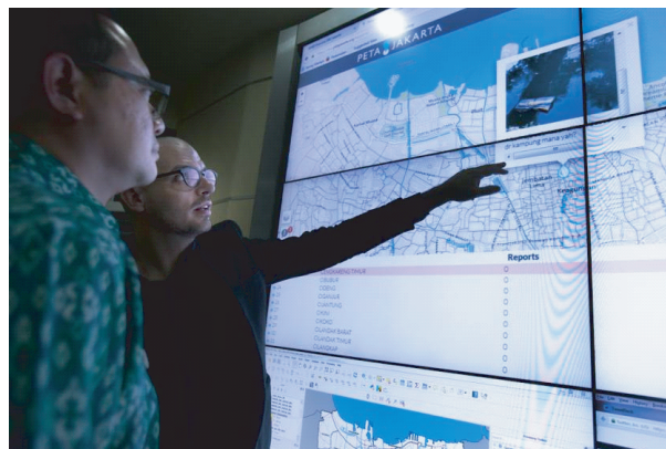
图3 印尼国家灾害管理局雅加达控制室

BNPB 的发言人 Sutopo Purwo Nugroho 强调了灾害管理中迅速反应的重要性,而社区通过社交媒体参与灾害管理又能发挥十分重要的作用.通过分享灾害信息,居民不仅能根据最新消息及时做出判断,而且能帮助包括 BNPB、BPBDs 和其他利益相关者更有效地处置灾情 [12] .