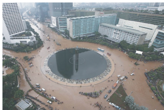
图 1 2013 年雅加达中央商业区的洪水

雅加达作为东南亚第一大城市,每年都会遭受洪水灾害的侵袭(图 1). 洪水对雅加达地区的近 3 000 万居民造成了严重影响,而近年来快速的城市化又加剧了雅加达对洪水风险的脆弱性 [9] . 以往收集洪水信息非常耗时耗力,由于缺乏数据,几乎没有信息能帮助及时协调响应和救援行动. 研究人员发现在强降雨事件发生时, Twitter 上的活动会出现一个巨大的峰值. 相比政府花费大量的精力收集数据和绘制洪水地图,以 Twitter 为代表的社交媒体在灾害信息传播方面拥有巨大优势.