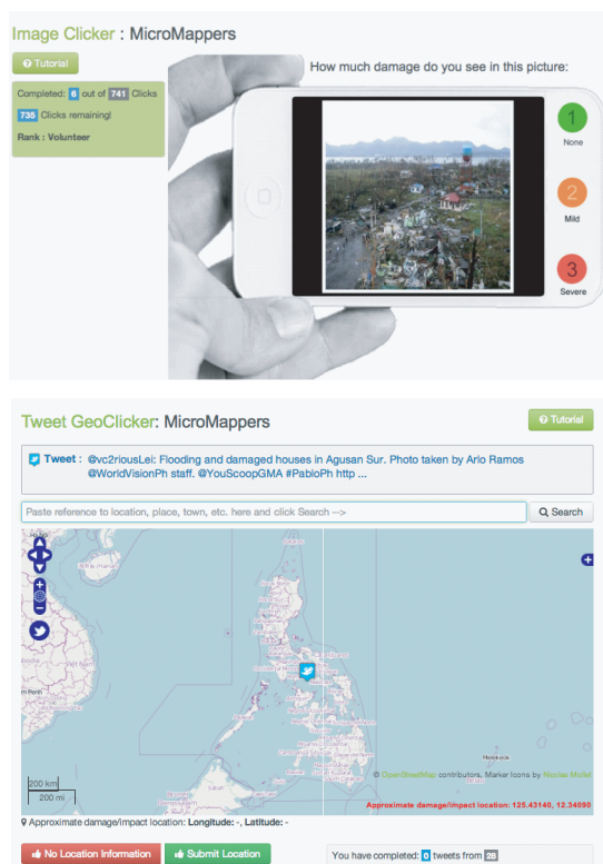
图 4 Clicker 标记推文和图片

MicroMappers 与其他分析社交媒体的软件不同,志愿者们只要安装 Clicker 应用程序即可完成工作(图 4)。不仅如此, Clicker 不需要经过专业操作培训,任何人在任何时间、任何地点都可实现信息的标记任务。