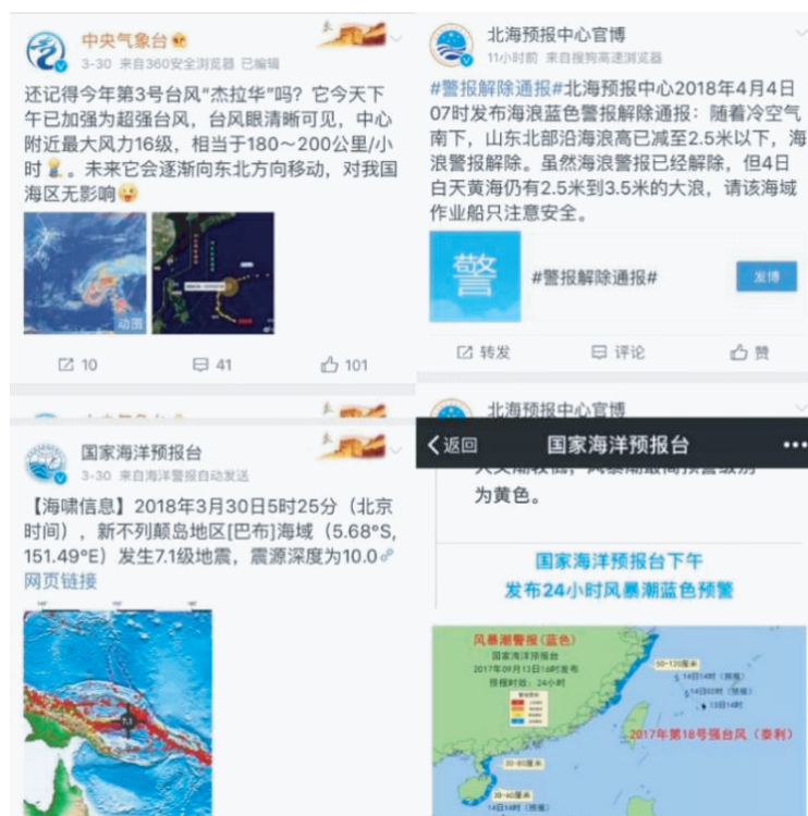
图7 微博与微信上海洋灾害信息发布情况