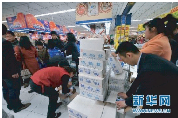
图5 中国各地出现抢购食盐现象